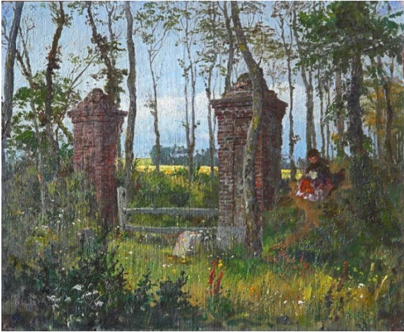
В.Д. Поленов. Старые ворота в Веле. Нормандия. 1874. Холст, масло. 24x30 Этюд для картины «В парке» 1874 года, находящейся в Государственном Русском музее.