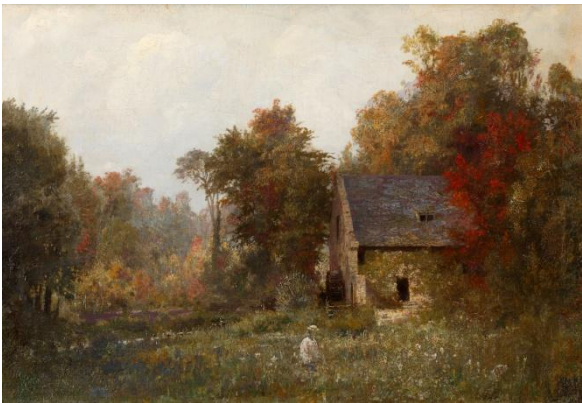
В.Д. Поленов. Мельница на истоке речки Вель. Этюд. 1874. Холст, масло. 38x55,5