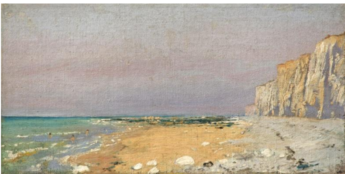
В.Д. Поленов. Нормандский берег. Этюд. 1874. Холст, масло. 14,5x28,5